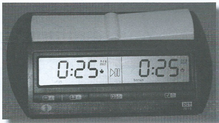
Przykładowy zegar elektroniczny.